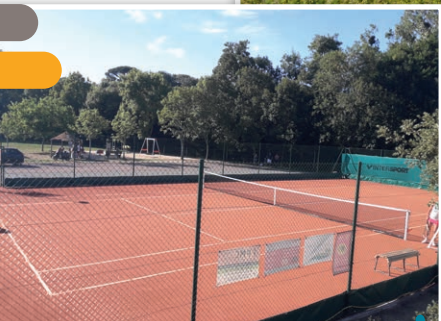
Le court de tennis