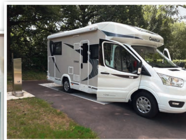
Aire de service

ÉQUIPEMENTS : Aire de jeux, tennis, piscine, salle TV, ping-pong, palets et pétanque.