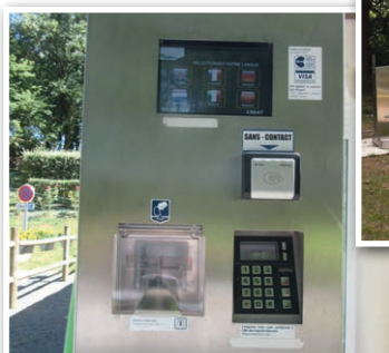
Borne d'accès automatique